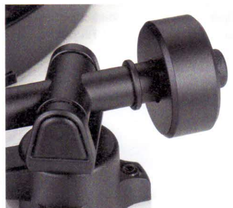
Wird das skallose Gegengewicht an den Stopper geschoben, stimmt die Auflagekraft für den vormontierten MM-Abtaster Rega Carbon.

Der Aufbau des Planar 1 Plus gelingt innerhalb kurzer Zeit. Sein Abtaster – leicht als Audio-Technica-AT91-Derivat erkennbar – ist exakt vormontiert. Das Gegengewicht