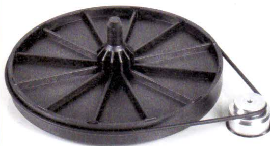
Der winzige Subteller hat schmale Riefen, auf denen die Plattenaufgabe ableitungstechnisch günstig ruht; Metall-Pulley und Kurzriemen.

Das Konzept der steifen, leichtgewichtigen Dreher, das Rega seit seinen Anfängen zu Beginn der Siebziger stetig optimiert, zielt genau darauf ab. Masse, behauptet Gandy, speichert Energie, die er dagegen möglichst schnell ableiten will. Sonst drohen Verluste in der Dynamik, würden Feininformationen im Musiksignal verschmiert. Und auch, wenn der Planar 1 das kleinste Modell der Briten ist, folgt er ebenfalls deren Low-Mass-Philosophie.